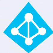
Azure Active Directory

Offre il supporto per lo spazio di lavoro e di collaborazione, e agisce da iniziatore di ogni automatismo