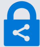
Microsoft Information Protection

Classifica e protegge i dati dei progetti confidenziali attraverso encryption e DRM sulle postazioni di lavoro e sullo spazio condiviso, e offre funzionalità avanzate di tracciamento e revoca dell'accesso alle informazioni